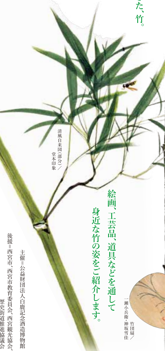
清風自來園(部分) / 堂本印象