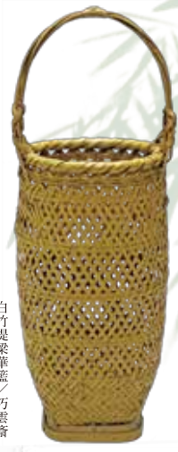
白竹提梁華籠 / 巧雲齋