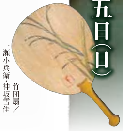
竹団扇 / 一瀬小兵衛・神坂雪佳