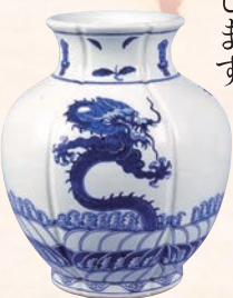
龍波濤文木瓜形花瓶

四方を海に囲まれ多雨で水に恵まれる日本では、水は身近な存在であり、多様な画題となって描かれてきました。はるか高い山から流れ落ちる瀧、荒く白い波しぶきを立てる波濤、穏やかにゆらめく水面、雨の様子。さまざまに描かれた水の姿を、近世から近代の日本画や工芸品からご紹介します。