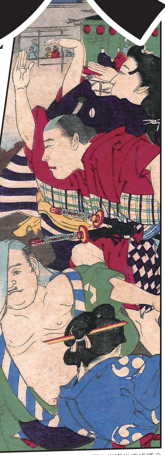
Exhibit descriptions are also available in English.