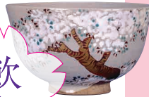
赤膚焼桜樹画茶碗