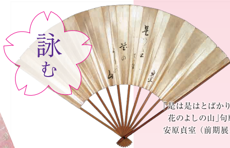
『是は是はとばかり 花のよしの山』句扇子 安原貞室 (前期展示)