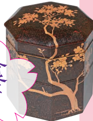
有職桜花蒔絵菓子器 (後期展示)