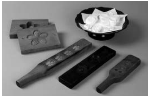
桜花文菓子型 (通期展示)

今回の展示では美術工芸品を「絵画」「陶磁器」「金工・木工・漆工」「版画」「着物・裂」の分野別に、笹部氏が遺した購入時の記録と併せて展観します。幅広い分野の作品に表された、多彩な桜の姿をお楽しみください。